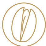
5. FRUTTA A GUSCIO