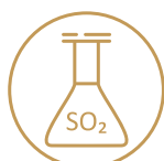
14. AOIDRIDE SOLFOROSA E FOLFITI

Per evitare spiacevoli inconvenienti si prega di informare preventivamente il nostro personale nel caso di allergie o intolleranze alimentari o nel caso in cui si stia seguendo una dieta vegetariana. Un nostro Responsabile incaricato è a vostra disposizione per fornire