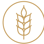
3. CEREALI CON GLUTINE