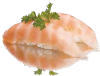
64 SALMON 2pz Bocconcini di riso con pancia di salmone .. € 4.00