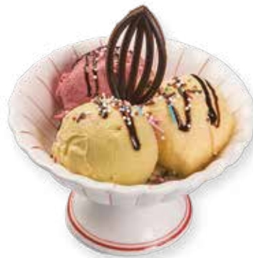
410 GELATO MISTO