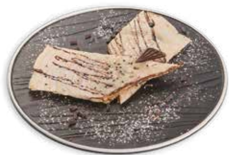
400 CREPES ALLA NUTELLA