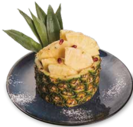
408 ANANAS FRESCO