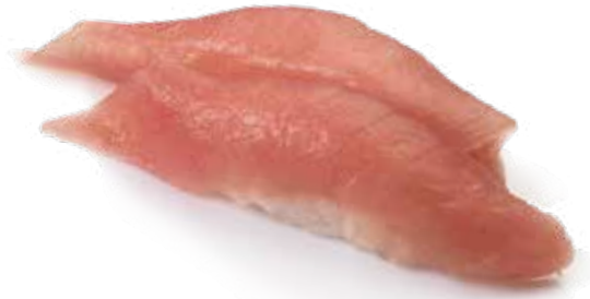
61 MAGURO 2pz Bocconcini di riso con tonno .. € 4.00