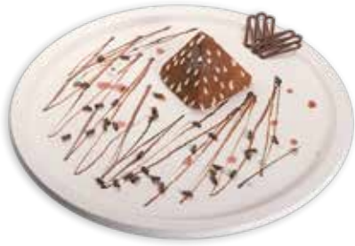
407 PIRAMIDE AL CIOCCOLATO