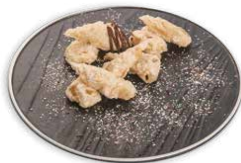
401 BANANA FRITTA