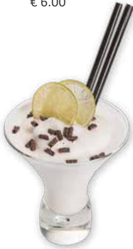
409 SORBETTO AL LIMONE