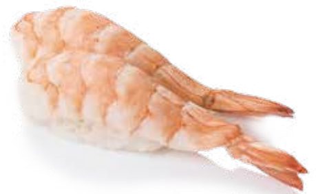
65 EBI 2pz Bocconcini di riso con gamberi cotti* .. € 3.00