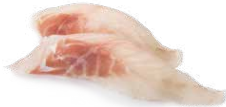
62 SUZUKI 2pz Bocconcini di riso con branzino .. € 3.00