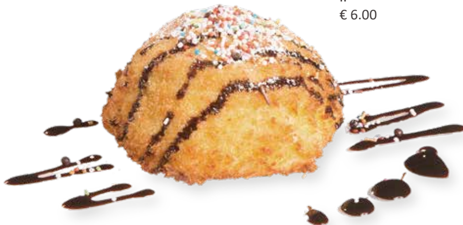
411 GELATO FRITTO