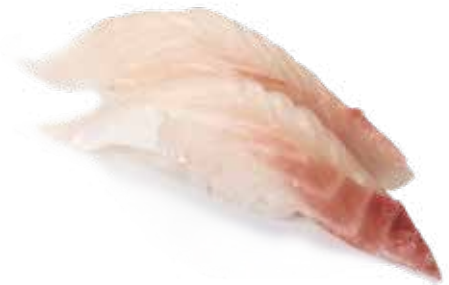
63 TAI 2pz Bocconcini di riso con orata .. € 3.00