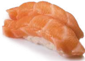
60 SAKE 2pz Bocconcini di riso con salmone .. € 3.00